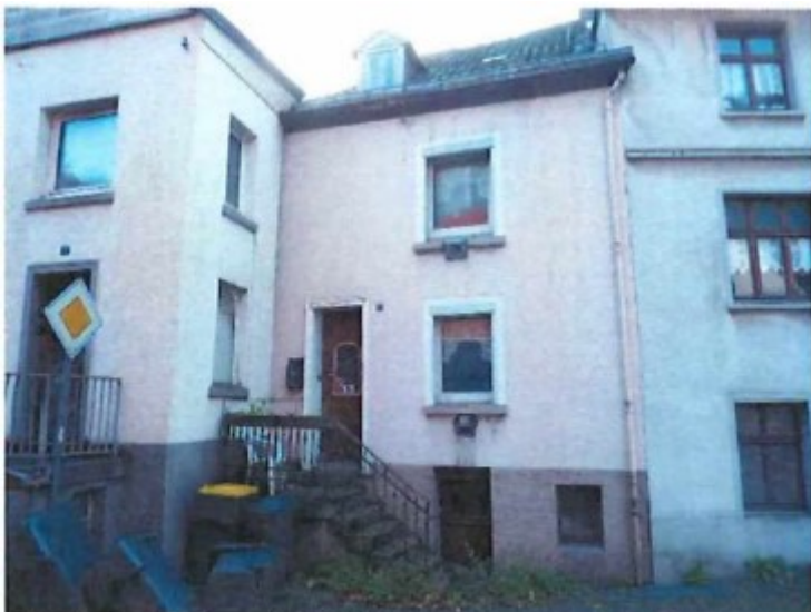
Gebäude Grabenstraße 2

Energieausweis: Entfällt, Ausnahmetatbestand EnEV.