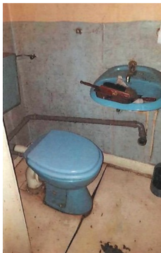
OG - Sanitärbereich

Weitere Fotos im Internet auf www.galundo.de Objekt Nr. 191