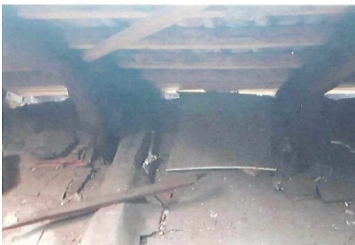
ungedämmtes, tlw. offenes DG