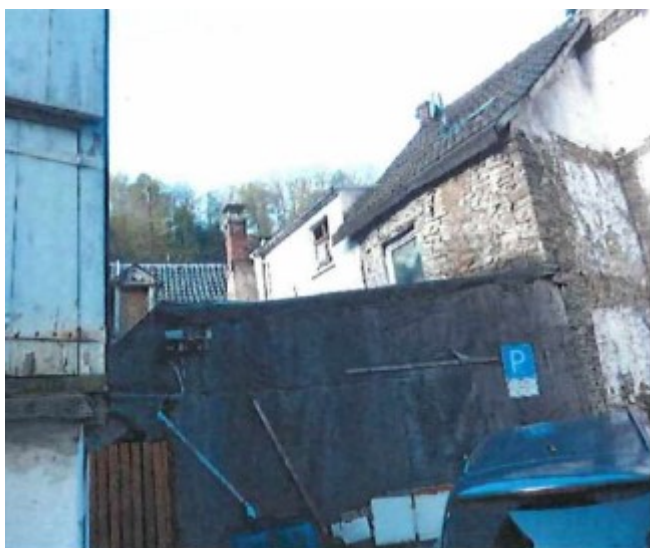
Rückseite des Objekts