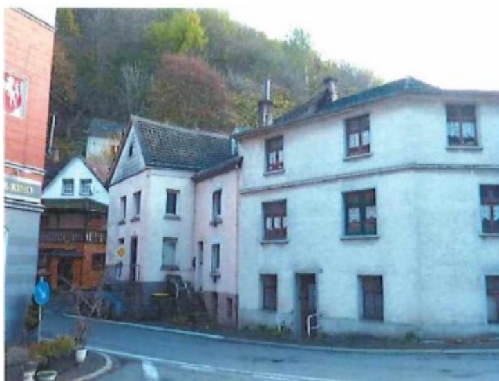
Gebäudeensemble mit Versteigerungsobjekt in der Mitte