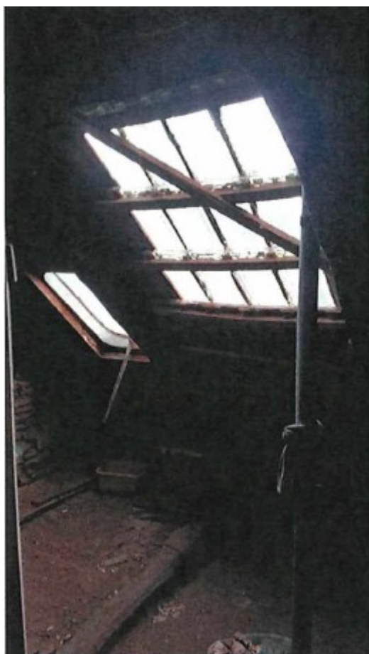
Dachboden, teilweise abgestütztes Dach